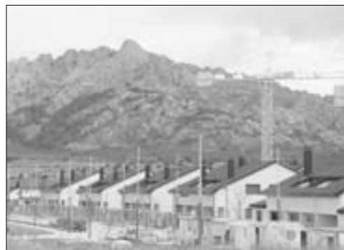
Se han venido a realizar recalificaciones urbanísticas con el Plan de Ordenación de los Recursos Naturales (PORN) de Guadarrama.

En 2006, Elclansol vendió estas parcelas por 4.371.000 euros. En total adquirió unas plusvalías de más de 4,6 millones de euros junto a sus socios por la venta de unos terrenos cuyo desbloqueo promovió como alto cargo del Gobierno de Esperanza Aguirre. Ahora la Fiscalía tiene cargos contra Porto por tráfico