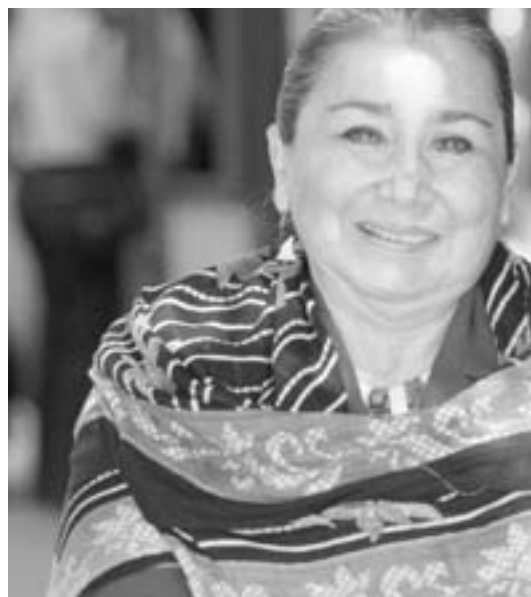
El Programa de Género de CEDAL viene a formar tres mil lideresas, gracias al apoyo de CCOO.

P. ¿No puede dar la impresión de que cuando en un país hay hambre es más fundamental la lucha contra el hambre que la lucha por problemas de género? Y en Perú hay problemas de nutrición, como lo demuestran programas como el vaso de leche, basado en garantizar la ingesta de un vaso de leche diario por los niños.