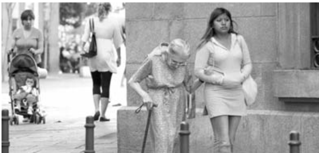
El Servicio de Ayuda a Domicilio sólo cubre el 14 por ciento de los ancianos mayores de 75 años.

Sólo se han baremado 3.000 solicitudes frente a un mínimo de 50.000 grandes dependientes que CCOO estima tendrían derecho a prestación ya