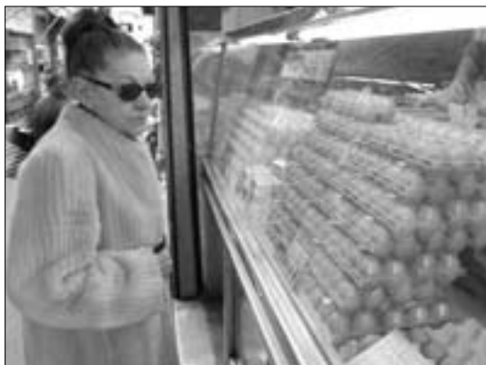
CCOO recuerda que los trabajadores madrileños viven en la región más cara de España.

CCOO considera que el aumento de precios es insostenible para los salarios más bajos