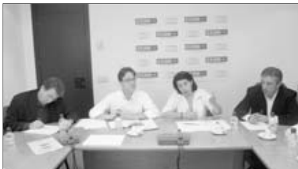
CCOO e IU en Madrid consideran importante apostar por el modelo industrial y por el empleo estable.

Javier López exige a Esperanza Aguirre «lealtad» a la hora de firmar el Plan Director en Prevención de Riesgos Laborales