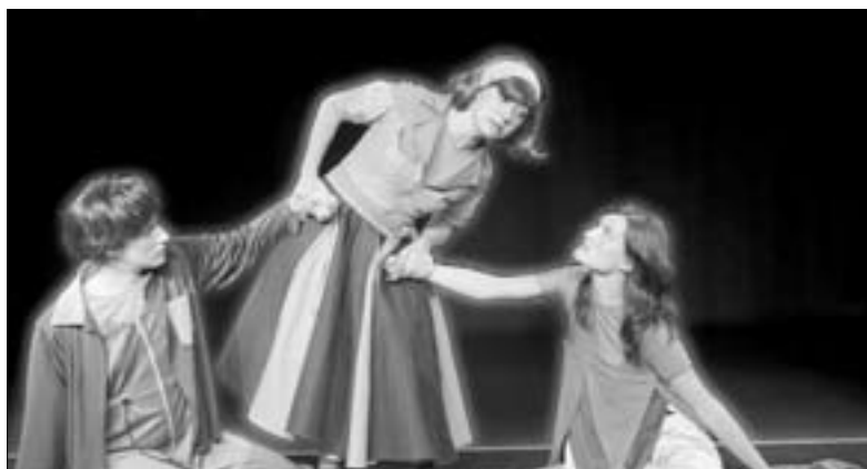
En la foto una escena de El cuento de la lechera , obra con la que se inaugura la XII Muestra de Teatro Infantil.

El 18 de noviembre, la Factoría de Teatro representará El cuento de la lechera (vamos a romper cántaros), basado en el cuento tradicional pero desbaratándolo, contando sueños reales, sueños de niños, sueños despiertos, sueños