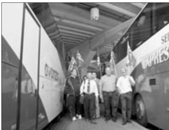
Concentración en la Estación Sur de Autobuses el pasado 23 de octubre.

Existe, también, un punto en el que ambas partes no se ponen de