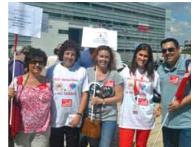
▲ Una de las concentraciones celebradas el pasado mes de septiembre por la readmisión de las compañeras.

CCOO está movilizándose y adoptando todas las medidas oportunas para conseguir la reincorporación de las compañeras. ■