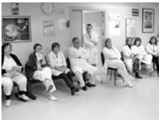
Los trabajadores sanitarios del ambulatorio de Aranjuez, en un momento del encierro, el pasado 10 de diciembre.