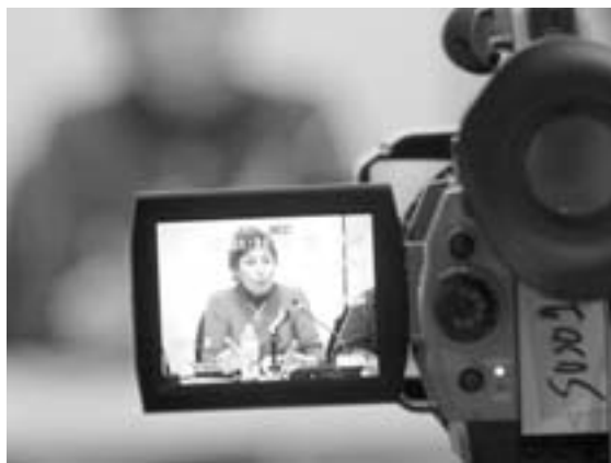
La falta de regulación, las condiciones precarias y la función social de la TV, reflexiones compartidas por los profesionales.