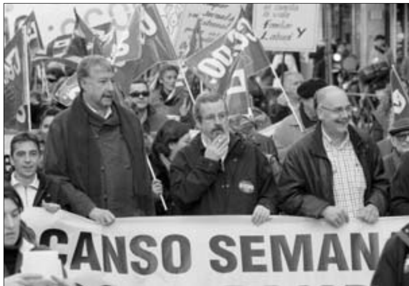
La ampliación de horarios comerciales afecta fundamentalmente a los trabajadores del comercio madrileño.

La Federación de Comercio, Hostelería y Turismo de CCOO concentró en la mañana del 14 de diciembre en la Puerta del Sol a más de un millar de delegados de toda España para reivindicar el derecho al descanso semanal efectivo de dos días en las grandes superficies comerciales. Desde la Federación, también se ha protestado por la ampliación de los horarios comerciales que ha aprobado el Gobierno de la Comunidad de Madrid y que aumentan en dos los festivos de apertura.