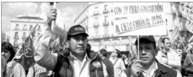
En la imagen dos trabajadores inmigrantes protestan durante la manifestación celebrada el 28 de abril con motivo del Día Internacional por la Seguridad y la Salud en el Trabajo.