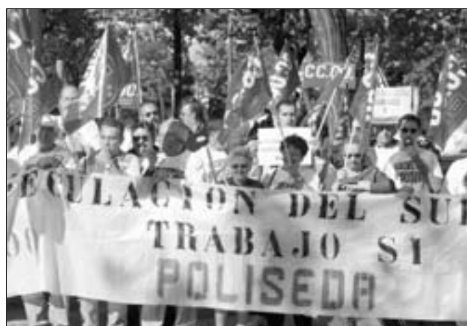
Los trabajadores reclaman la continuidad de la empresa con unos dueños u otros.

Carlotti. Por otra parte, desde la sección sindical de CCOO se destaca que a partir de enero, Antena 3 será expulsada del Ibex-35 (valor de referencia de la cotización bursátil en nuestro país), al ser valorada como una de las peores empresas.