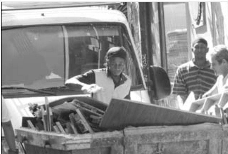
El trabajo decente debe estar en el centro de las políticas de cooperación al desarrollo, económicas, financieras y sociales a escala internacional.

Con todo, es fundamental que tomemos conciencia del trabajo digno más allá de nuestras fronteras. Las olimpiadas pueden ser un punto de partida en la lucha por el trabajo decente.