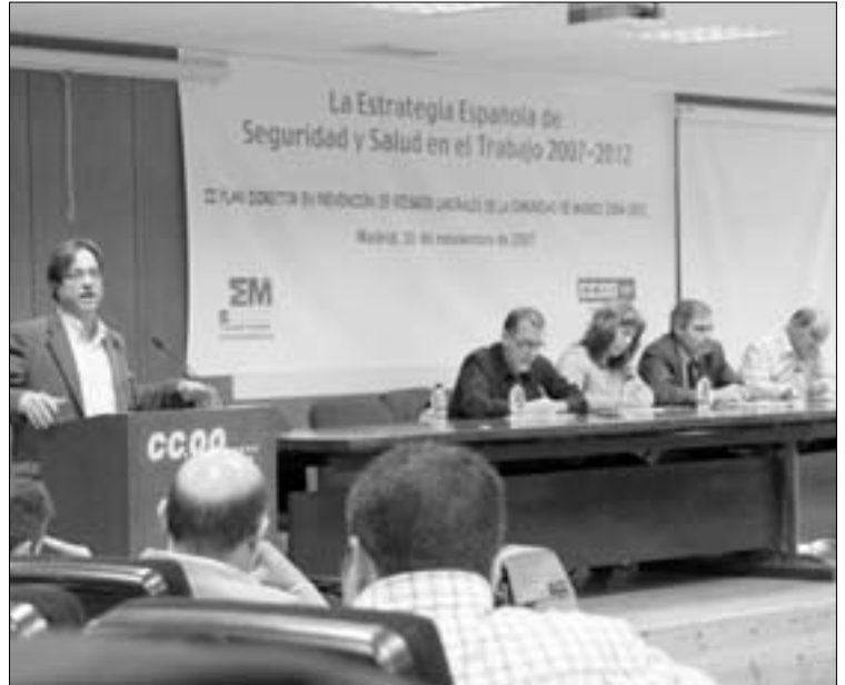
Los participantes de la jornada coincidieron en señalar la escasa aplicación de las normas de seguridad -sólo un tercio de las empresas cumple de forma razonable-.

CCOO de Madrid debatió sobre la Estrategia Española de Seguridad y Salud en el Trabajo y su aplicación en Madrid