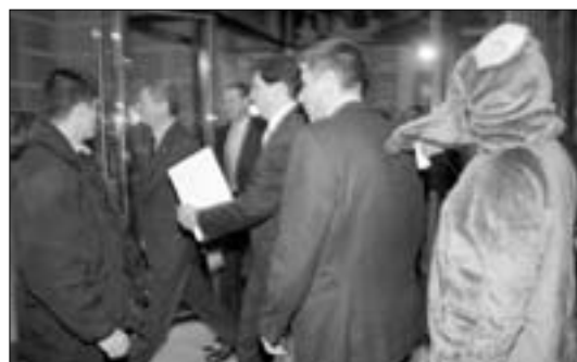
«Ratardón», personaje con el que CCOO protesta por la privatización de los servicios municipales, aparece allí donde va el alcalde