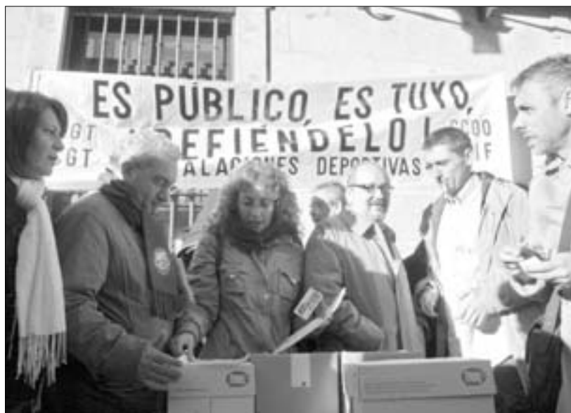
Las movilizaciones continuarán si no hay respuesta por parte del Gobierno regional.