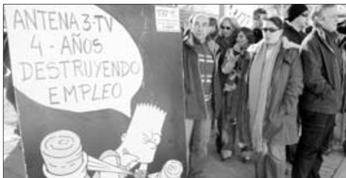
A pesar de las presiones, la huelga en Antena 3 TV fue un éxito.

Con todo, la huelga fue masivamente seguida