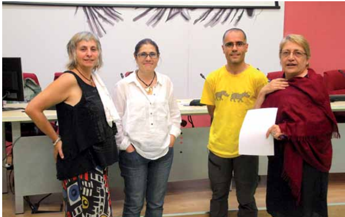
▲ Estas jornadas fueron organizadas por la Fundación Ateneo Sindical Ateneo 1º de Mayo y la Fundación Hogar del Empleado FUHEM. También contó con la colaboración de Secretaría de Medio Ambiente de CCOO de Madrid y el Sindicato Joven.