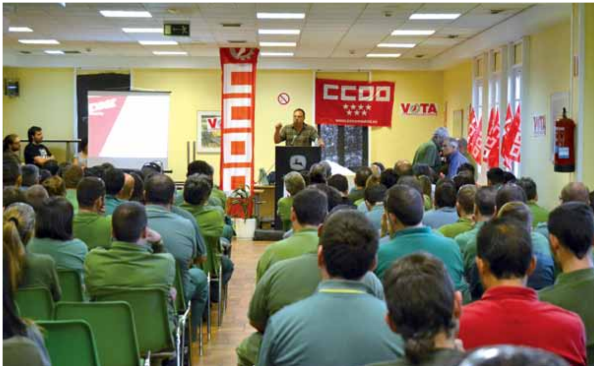
▲ Asamblea de trabajadores y trabajadoras en John Deere.

CCOO de Industria de Madrid afronta el periodo álgido de elecciones con más de 800 delegados de diferencia. La Federación ha sumado en las últimas semanas el apoyo de los trabajadores y trabajadoras de diferentes empresas de sus sectores en las elecciones sindicales que se han ido celebrando. Es el caso de Stryker Ibérica, Carglass, John Deere Ibérica o IBM.