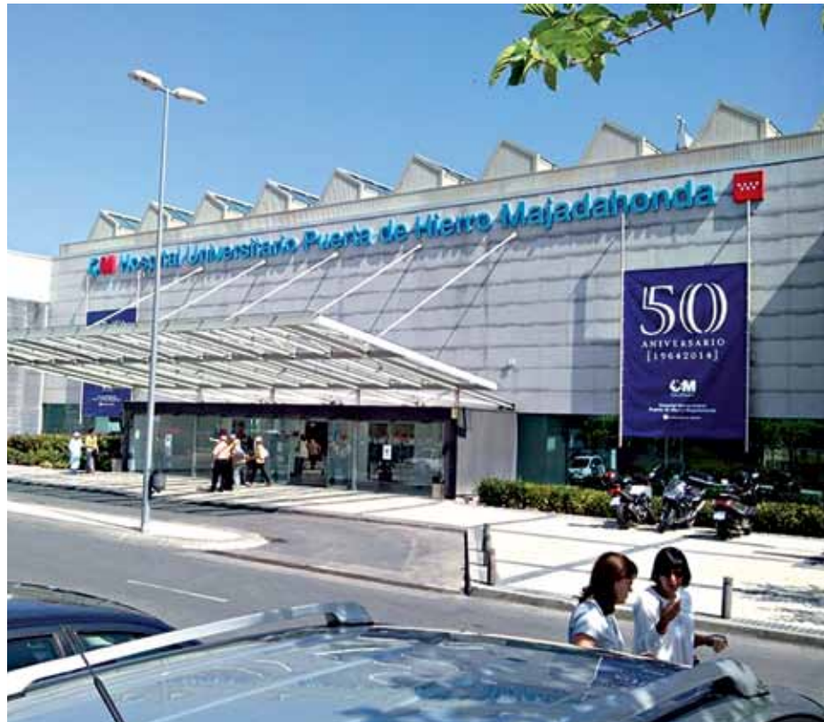
▲ El fallo supone una nueva victoria contra los planes privatizadores del PP

La sentencia se centra en cómo se concretó la amortización de puestos de trabajo a raíz de la resolución de la administración sanitaria madrileña, fechada el 22 de marzo de 2013. Y lo hace argumentando que el Servicio Madrileño de Salud no podía suprimir estos puestos de trabajo al estar expresamente vinculados a una oferta de empleo de la Comunidad de Madrid, algo que negaba la Administración. Sin embargo, se considera probado que dicha vinculación fue realizada por la Gerencia del hospital Puerta de Hierro, en una resolución fechada el 2 de julio de