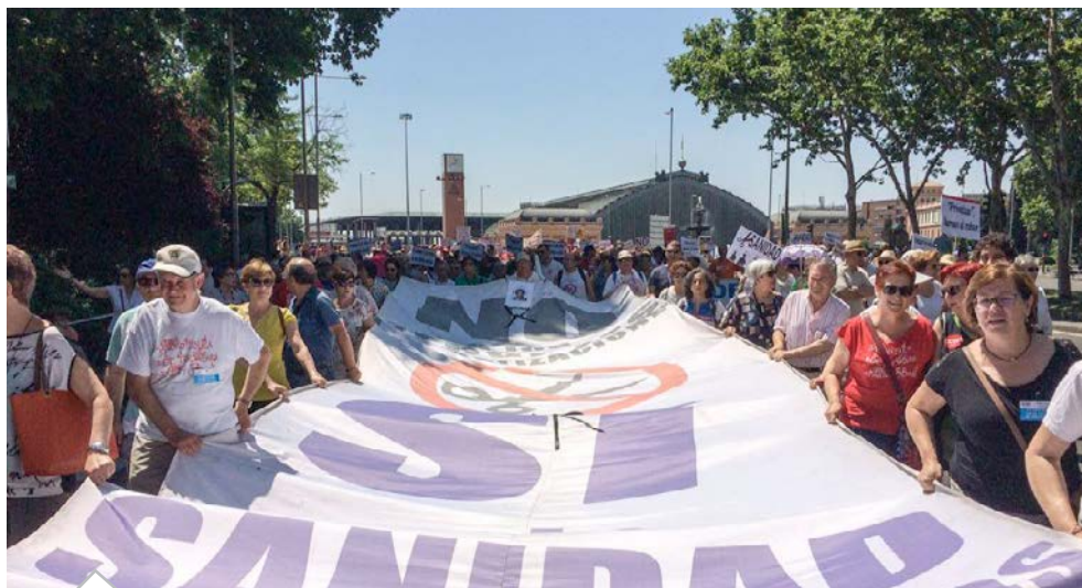
33ª Marea Blanca en Madrid. Este domingo, día 21, CCOO volvió a manifestarse, junto con la Marea Blanca, en defensa de la sanidad pública. En esta ocasión la marcha transcurrió entre el Colegio de Médicos y el Ministerio de Sanidad.