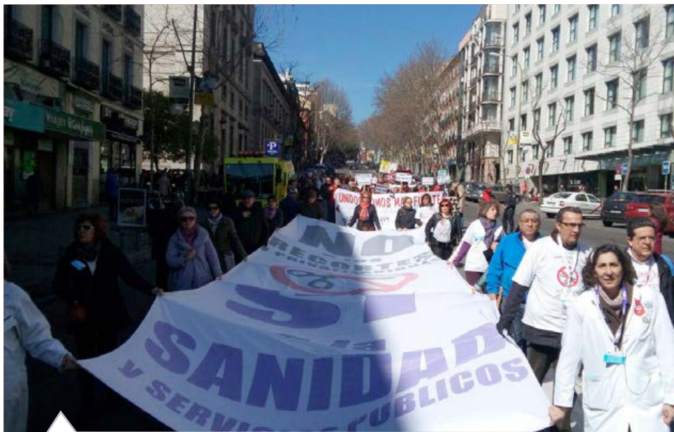
“Menos camas, más quejas, menos calidad”. La Marea Blanca, de la que forma parte CCOO, volvió a inundar las calles de Madrid para alertar de la situación de la Sanidad. La marcha puso de relieve que la presentación de la Memoria del Sermas 2015 ha dejado al descubierto “todas las carencias propiciadas para destartalar la Sanidad Pública y buscar la justificación de entrega de su función, con llave en mano a empresas privadas que tienen como prioridad el menor coste y el máximo beneficio”.