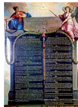
Declaración de los Derechos del Hombre y del Ciudadano aprobada por la Asamblea Nacional de Francia, 26 de agosto, 1789

Sus antecedentes se remontan al siglo XVII, cuando empiezan a contemplarse declaraciones explícitas con base en la idea contemporánea del "derecho natural". Inglaterra incorpora en 1679 a su constitución la "Habeas Corpus Act" (Ley de hábeas corpus) y la "Declaration of Rights" (Declaración de derechos) en 1689. En Francia, como consecuencia de la Revolución, se hace pública, en 1789, la Declaración de los Derechos del Hombre y del Ciudadano.