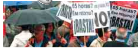
4 7 y 17 de octubre: Los trabajadores del mundo se unen