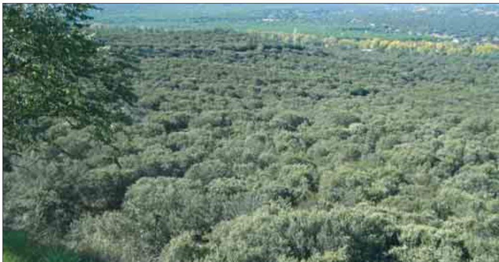
La Comunidad de Madrid está cuestionando estudios realizados por el Consejo Superior de Investigaciones Científicas sobre El Pardo.

La respuesta de la Consejería de Transportes a las alegaciones presentadas por CCOO sobre el cierre norte de la M-50 está plagada de lamentables errores y carencias