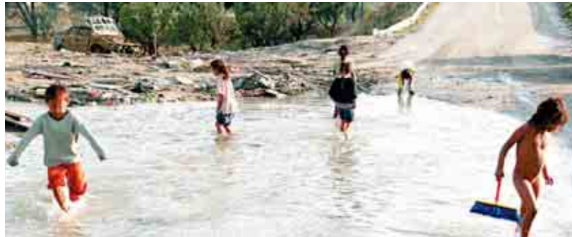
Niños de todas las edades corren, juegan y se pelean. Unos vestidos, otros medio desnudos, descalzos la mayoría.

En el último mes, dos tormentas y, posiblemente, las obras que se están llevando a cabo para conectar la A3 con la M-45 y las entradas al ensanche de Vallecas han provocado inundaciones en Coslada y Rivas. Además de las casas y comercios anegados, el agua ha convertido en un lodazal terciomundista el asentamiento chabolista rumano de la zona denominada El Gallinero. Madrid Sindical estuvo allí acompañando las labores de ayuda de un sindicalista de Comisiones Obreras, voluntario de una parroquia cercana.