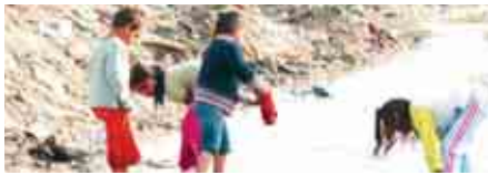
7 Poblado El Gallinero. En tierra de nadie

COMISIONES OBRERAS DE MADRID • NÚMERO 129 • NOVIEMBRE 2008 • WWW.CCOOMADRID.ES