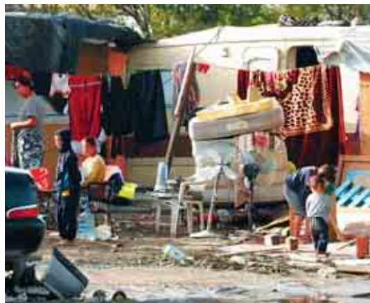
Por debajo de los mileuristas también hay un largo segmento de población.

El primer segmento se podría calificar como de los «mileuristas», aquellos trabajadores que, en el mejor de los casos, llegan a los mil euros como retribución mensual. Ese es su tope salarial, «la mitad de la renta media disponible en España». Su punto salarial más alto equivale a 1,5 veces el Salario Mínimo Interprofesional. En esta franja se encuentran los trabajadores que carecen de la cobertura de un convenio colectivo. Por supuesto, aquí encontraríamos a todos los trabajadores con contratos basura, o sin tan siquiera contrato, cobrando por horas trabajadas a precios bajísimos.