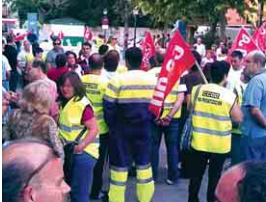
La defensa de lo público en Valdemoro reunió a un millar de personas.