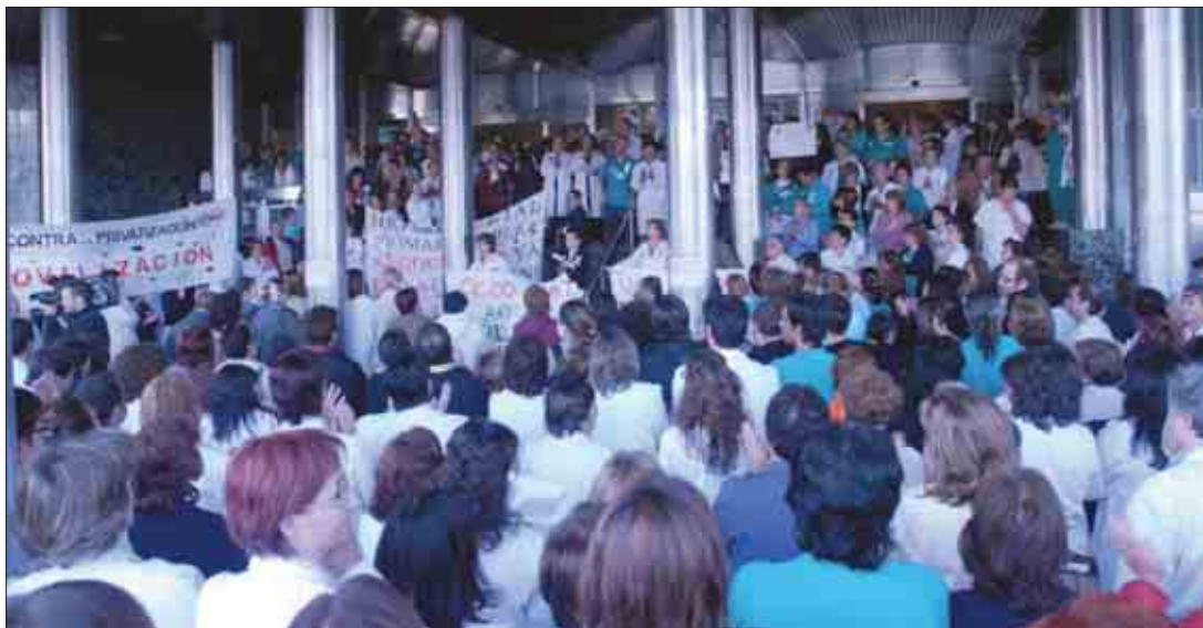
Centenares de trabajadores se concentraron en el hospital Ramón y Cajal dentro de las movilizaciones que están teniendo lugar en los centros hospitalarios.