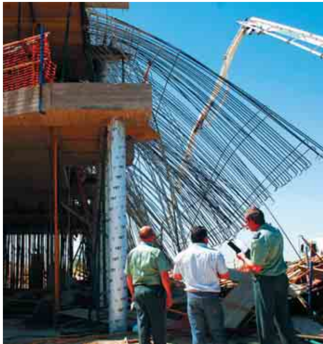
Los empresarios incumplen reiteradamente la normativa y tienen una actitud inaceptable

La dimensión económica de la situación se evidencia ante el importe de las sanciones derivadas de las actuaciones inspectoras en España durante 2005, que fue de 117.389.855 euros y se produjeron 2.212 paralizaciones.