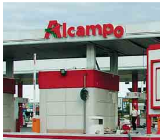
Las empresas han generado confusiones interesadas entre conceptos como jornada y horario, lo que, unido a la redacción de la propia norma, ha hecho que hubiera interpretaciones judiciales contrarias a la finalidad del derecho.

«Ha sido necesaria la doctrina del Tribunal Constitucional para frenar la oposición sistemática de las grandes empresas a que la mujer ejercitara el derecho a la elección del periodo, horario y reducción de jornada por guarda legal»