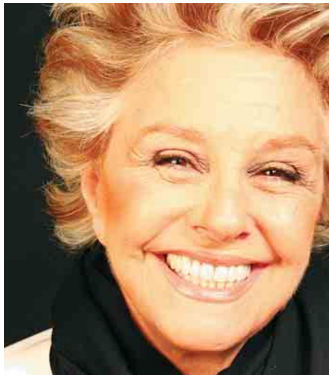
LOLA HERRERA | ACTRIZ

La actriz Lola Herrera, uno de los referentes interpretativos de la escena española, recorre los teatros de Madrid en noviembre con la obra Seis clases de baile en seis semanas