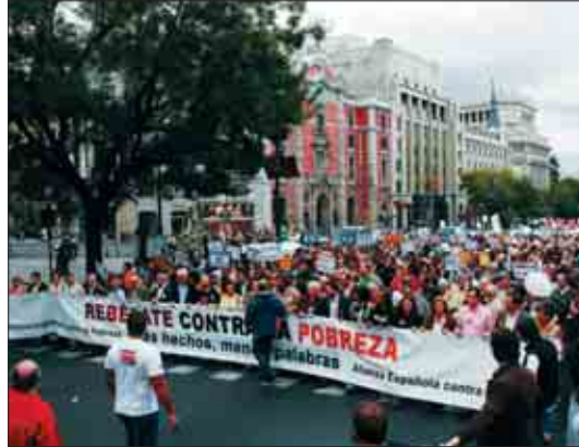
El 17 de octubre, todos estuvimos unidos a pesar de la lluvia, que empezó amenazando y terminó mojando.

Por su parte, Guillermo Fesser, el otro integrante de Gomaespuma, ironizó sobre los políticos «que nos toman el pelo», al decir que no hay dinero para «ayudar a los países más necesitados y a la gente que tiene hambre», pero sí «para ayudar a unos tíos que han