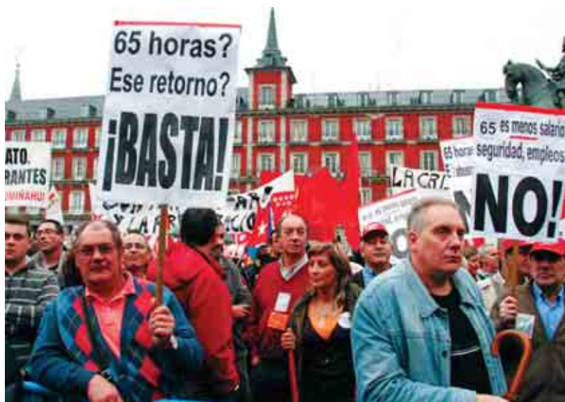
El 7 de octubre ha supuesto la primera gran movilización planetaria en reclamar un trabajo con contrato, salario digno, protección social básica, derechos sindicales y diálogo social.

Alrededor de 20.000 trabajadores, según los sindicatos, se concentraron en la Plaza Mayor de Madrid para sumarse a la jornada mundial «Por el trabajo decente», convocada a nivel internacional por la Confederación Internacional Sindical (CSI). En España, la movilización se centró contra la directiva europea que prevé aumentar la jornada laboral a 65 horas semanales, y en Madrid, además, contra los furibundos ataques que desde el Gobierno de Esperanza Aguirre se están llevando a cabo contra los grandes sindicatos de clase.