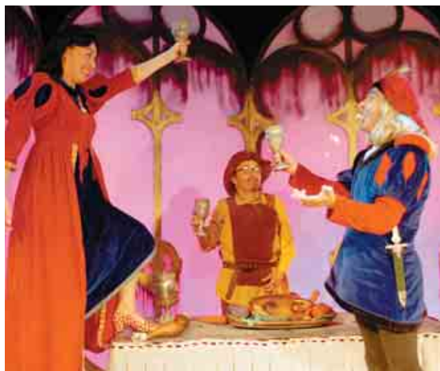
La Machina Teatro presenta La danza del sapo , divertida revisión de un cuento clásico, La bella durmiente .

El 7 de diciembre es el día de La Carraca, que vuelven por enésima vez al Auditorio «Marcelino Camacho» tras llenar el teatro en todas las anteriores oca-