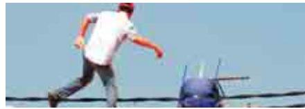
13 Salud Laboral y Medio Ambiente. Más valdría prevenir que curar