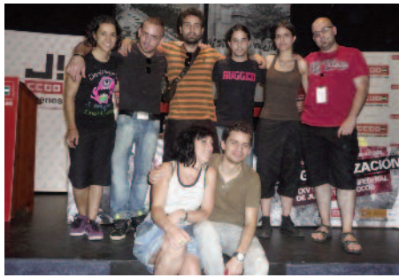
Delegación de Madrid