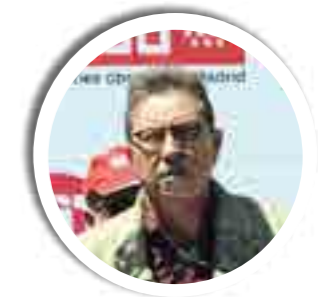
Jaime Cedrún López Secretario General de CCOO de Madrid

El secretario general de CCOO dedicó buena parte de su intervención a la tragedia del terrorismo machista y a las distintas violencias que se ejercen contra las mujeres, violencia que juzgó intolerable en cualquier sociedad, de manera singular en las sociedades democráticas. El sindicato debe implicarse con decisión y coraje en la acción contra la desigualdad social y de género, contra la brecha salarial que no cesa, y debe comprometerse activamente en la lucha diaria por la igualdad. “No basta con denunciar, hay que actuar, hay que legislar, hay que parar esta sinrazón”, ha declarado Toxo. ■