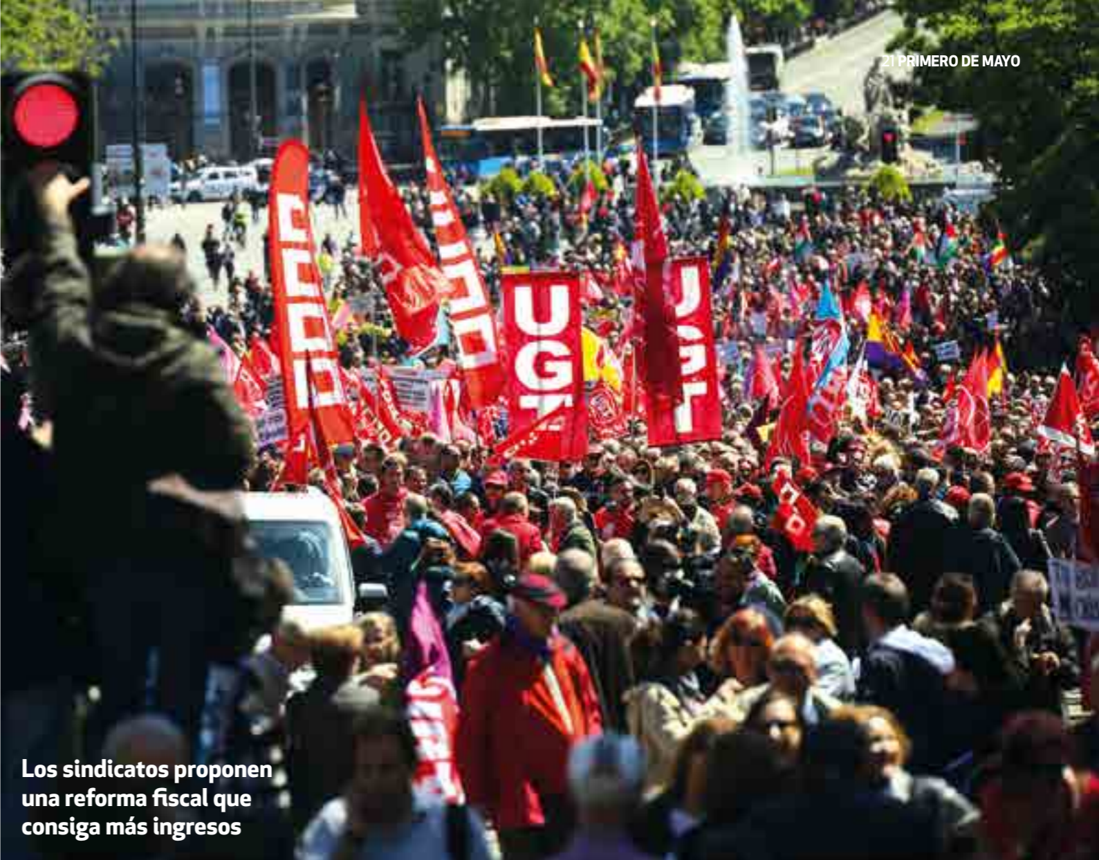
Los sindicatos proponen una reforma fiscal que consiga más ingresos

Asimismo, los sindicatos proponen una reforma fiscal que consiga más in-