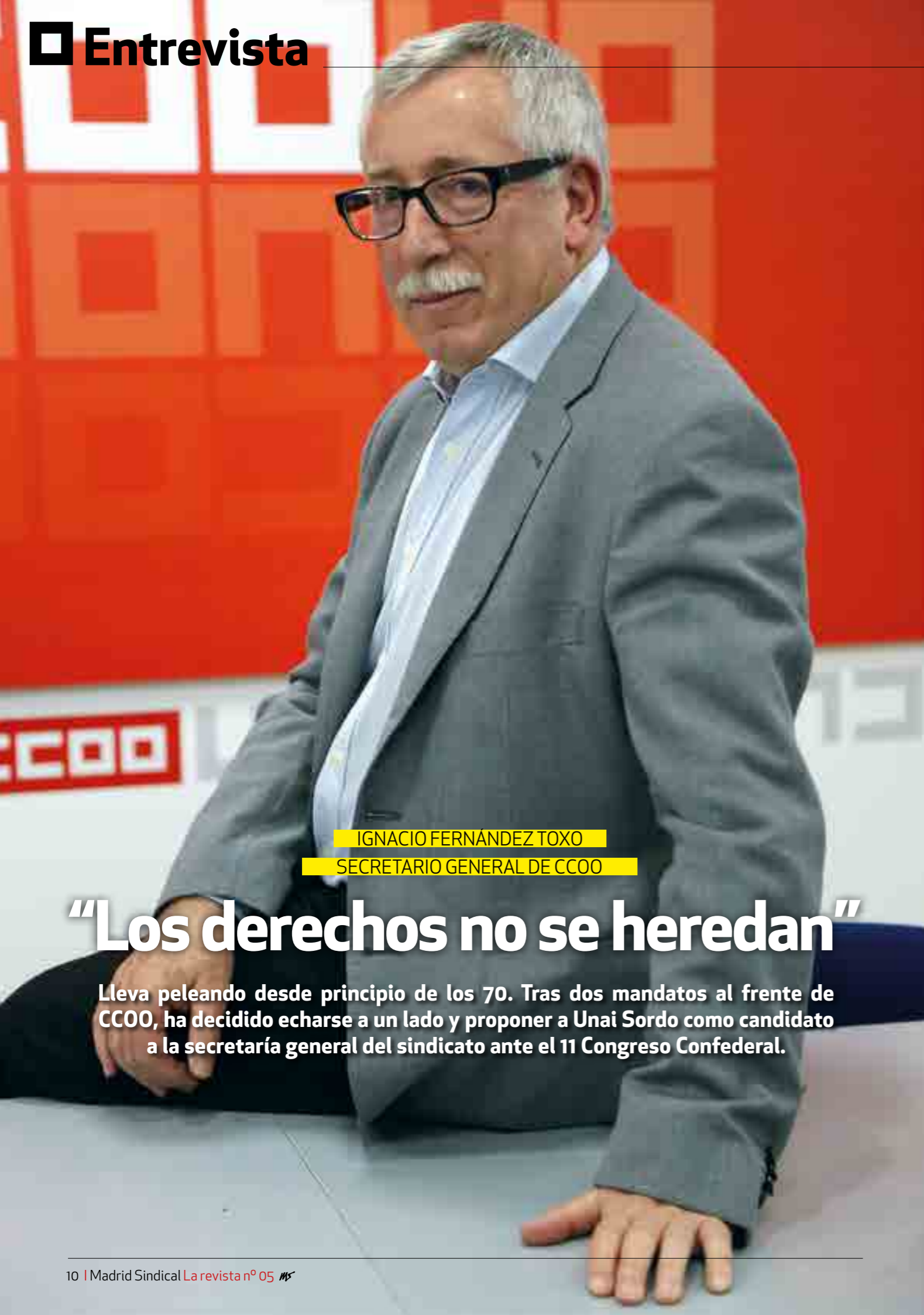
IGNACIO FERNANDEZ TOXO