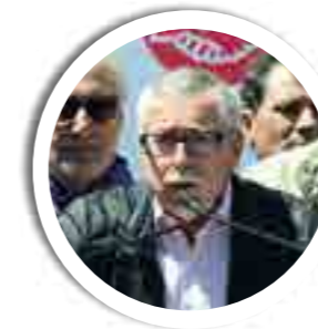
Ignacio Fernández Toxo Secretario General de CCOO

En 1977, los sindicatos son legalizados dos días antes del 1º de Mayo, pero la manifestación prohibida. Las centrales convocan pacíficamente. Por fin, en 1978 se celebra el 1º de Mayo en libertad. Un primero de Mayo unitario que desbordó las calles de España. ■