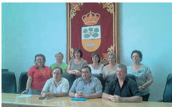
▼ Las trabajadoras readmitidas junto con los representantes de CCOO y el Ayuntamiento

Después de conocer la sentencia del TSJM, donde se estimaba el recurso interpuesto por CCOO ante el despido de seis trabajadoras laborales fijas pertenecientes a la plantilla del Ayuntamiento de Villacañeros, el actual equipo de gobierno (PP) y el sindicato CCOO, en aras de normalizar las relaciones laborales en el ámbito de este Ayuntamiento y en cumplimiento de lo señalado en la propia sentencia, han sellado un acuerdo por el cual se establece que el cumplimiento de la sentencia se realice con el desarrollo del acuerdo firmado entre las partes. En éste se incluye readmitir a las seis trabajadoras en sus puestos de trabajo a los cuales optaron mediante la