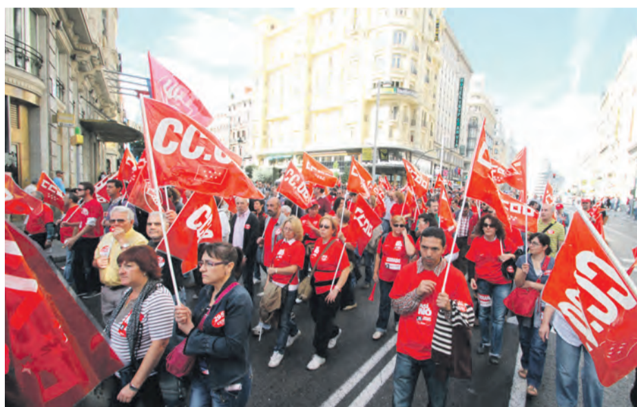
▼ El Gobierno regional fija servicios mínimos arbitrariamente, sin distinguir entre los que son esenciales y no lo son.