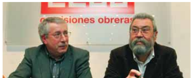
Toxo y Méndez reunirán a sus ejecutivas periódicamente e informarán conjuntamente de sus propuestas.

Pese a las diferencias que separan a las organizaciones empresariales de las sindicales, CCOO y UGT todavía confían en poder llevar a buen puerto la renovación para 2009 del Acuerdo Interconfederal de Negociación Colectiva (ANC), que llevan firmando con CEOE y CEPYME desde hace años. Eso sí, avisan que el proceso de negociación para dicha renovación no debe llegar más allá de febrero y que es necesario activarlo y cerrarlo cuanto antes.