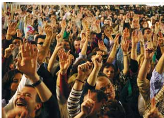
Momento de la ratificación del acuerdo en la asamblea de trabajadores.

En cuanto a los salarios, el texto acordado prevé para el 2009 un complemento mensual de 90 euros de los 450 euros mensuales que comprometieron en el 2007 y de los que los trabajadores sólo es-