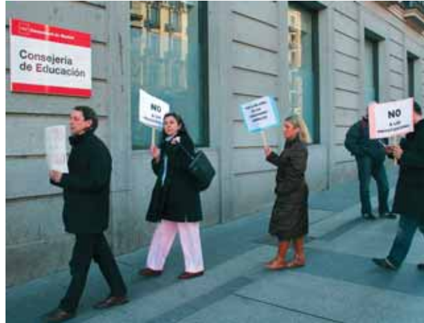
Delegados sindicales de la zona Sur en una rueda americana frente a la Consejería de Educación

En cuanto a la normativa existente, las organizaciones sindicales piden la creación de un nuevo decreto de escolarización que corrija los desequilibrios existentes y la derogación de los actuales decretos de educación infantil que han supuesto el deterioro de la calidad en la atención a este tramo de edad.