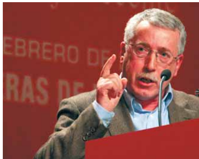
Ignacio Fernández Toxo

«La única dependencia que tenemos son los trabajadores»