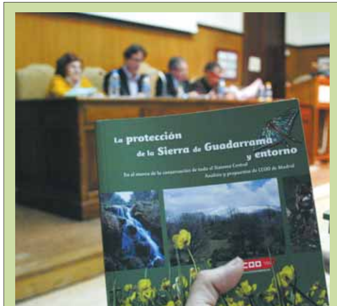
El PORN de Aguirre es una caricatura, un insulto a la inteligencia de los ciudadanos que tenemos que desenmascarar.