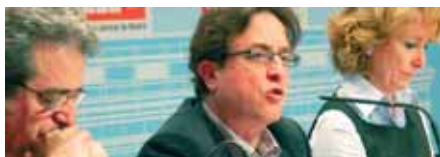
3 Pistoletazo de salida al diálogo social

CCOO COMISIONES OBRERAS DE MADRID • NÚMERO 133 • MARZO 2009 • WWW.CCOOMADRID.ES