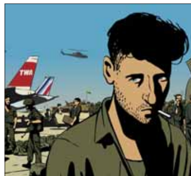
Vals con Bashir.

sional y amoroso que revolucionará el mundo de la cocina. Es recomendable acudir a la proyección sin hambre, eso sí.