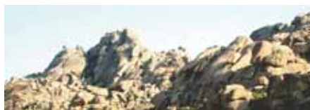
11 Salvar la sierra es salvar Madrid