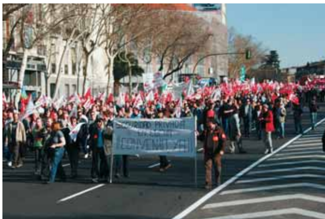
Pistoletazo de salida a las movilizaciones en seguridad privada.

Con el lema «Seguridad Privada: 100.000 trabajadores sin convenio», 5.000 vigilantes se concentraron en Atocha el pasado 24 de febrero. Fue el inicio de las movilizaciones convocadas en todo el Estado en defensa de un convenio del sector. En Madrid hay 25.000 trabajadores de este sector. La mesa negociadora se rompió el 20 de enero. CCOO denuncia que la patronal se escuda en una crisis que no le afecta, a tenor de los beneficios de sus cuentas, para dejar sin subida salarial a los trabajadores y recortarles derechos como la antigüedad, para los que pide un salario base digno. Las condiciones de trabajo de los guardias de seguridad son pésimas, trabajan muchas horas y con salarios muy bajos.