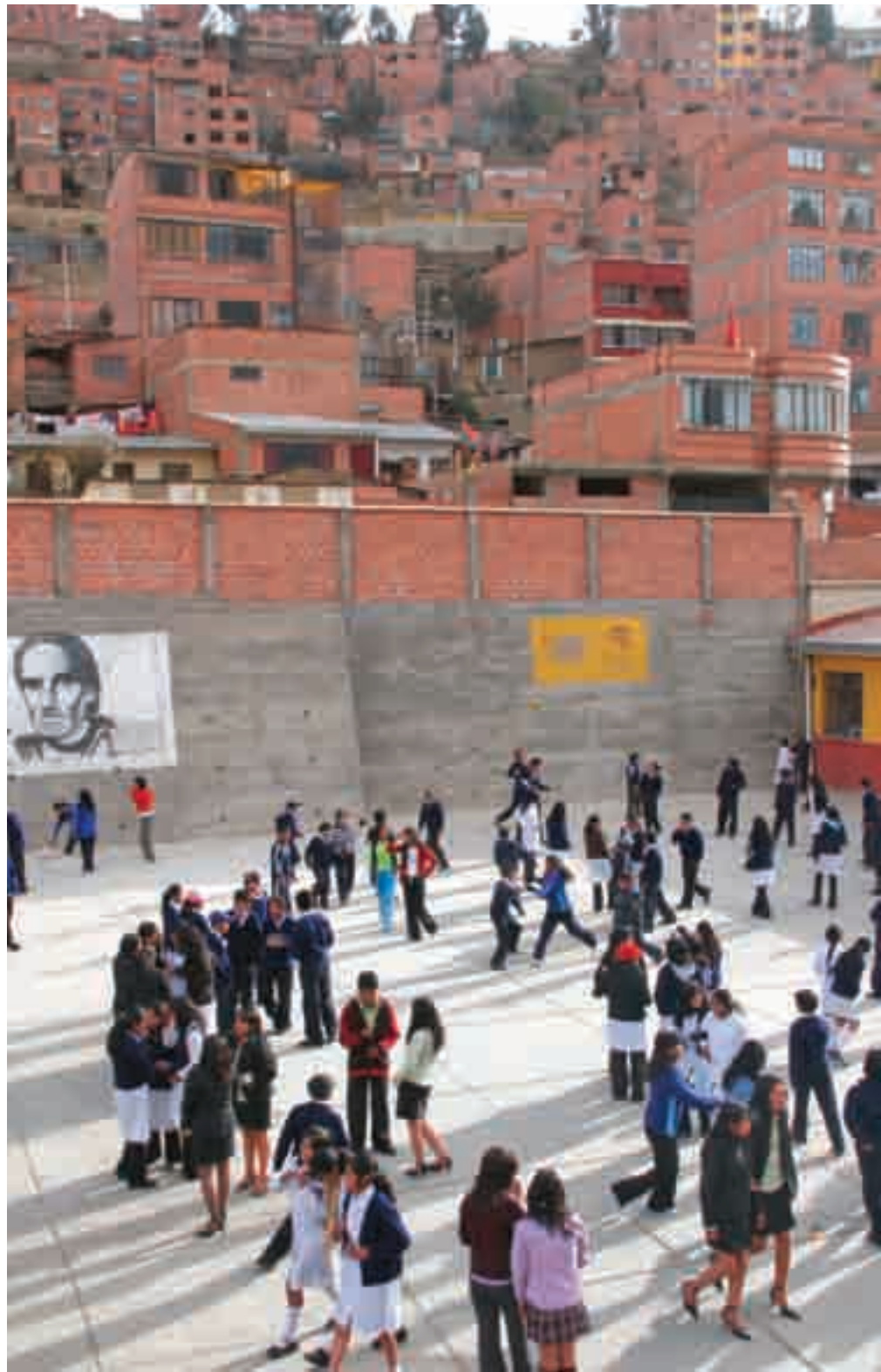
La escuela Luis Espinal Camps está situada en Pasankeri y tiene más de 800 alumnos de primaria y secundaria.

Como rindiendo tributo a la cumbre del Illimani, majestuoso e imponente, se encuentra la ciudad de La Paz. En esa ciudad aterrizaron los profesores y profesoras del Instituto Juan de Mairena de San Sebastián de los Reyes y los responsables de la Unión de Madrid de CCOO y de la Fundación Madrid Paz y Solidaridad. La calidez de la bienvenida de las personas responsables del Centro Comunal El Carmen hizo más llevadero el frío invierno boliviano que les recibió a su llegada.