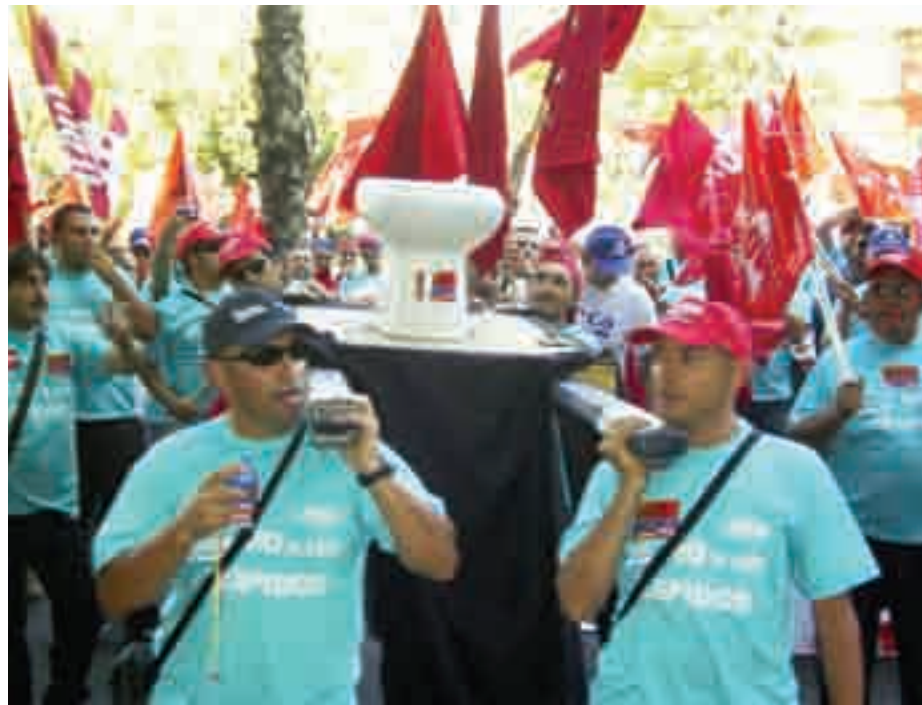
El número de despidos en Roca es «desproporcionado».

El acuerdo definitivo reúne los requisitos exigidos para garantizar el empleo, desta-