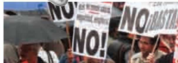
3 7 de octubre: Jornada Mundial por el Trabajo Decente

AGUIRRE LANZA CORTINAS DE HUMO Y FUEGOS DE ARTIFICIO