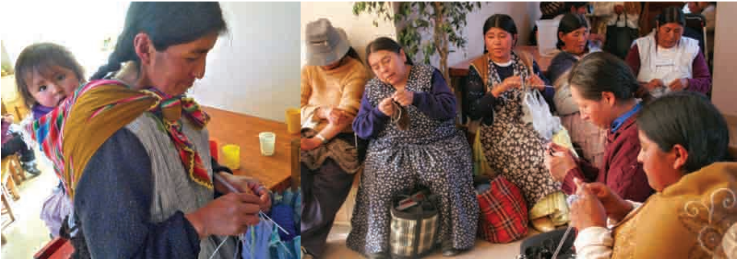
Manuel Higuera / Fundación Madrid Paz y Solidaridad.

Las zonas de Pasankeri y Llojeta son los barrios (zonas periurbanas) de los arrabales de la capital. El barrio de Pasankeri está ubicado al noroeste de la ciudad, en una ladera con una media de 600 metros de desnivel. Su población alcanza los 150.000 habitantes, en un primer momento emigrantes de las zonas campesinas del Altiplano pacense y, posteriormente, mineros que emigraron tras el cierre de las minas de Potosí. Lo mismo ocurre con el barrio de Llojeta, con casi 40.000 habitantes básicamente de origen del Altiplano, en su mayoría emigrantes recientes. En los últimos años se han mejorado en ambos barrios las condiciones de salubridad, así como la situación de sus habitantes, gracias a la acción directa del Centro Comunal El Carmen. Se les ha ayudado a legalizar los terrenos, se han asfaltado las calles, se han llevado servicios básicos como agua potable, alcantarillado, se han canalizado los ríos que atraviesan el barrio, la construcción y funcionamiento de escuelas, de mercados, el transporte público y recientemente el gas; todo ello tras las movilizaciones que durante años han llevado a cabo los habitantes de estas zonas.