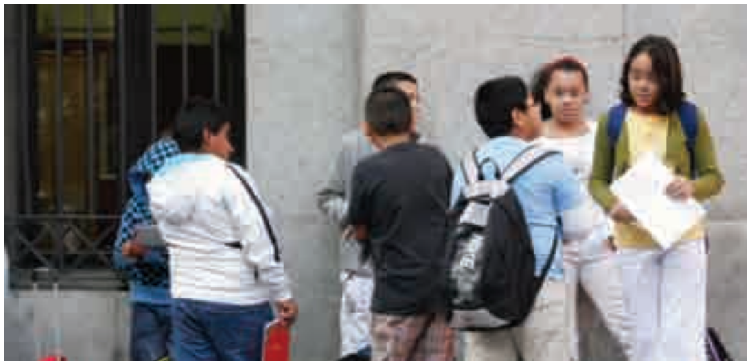
En el centro de Madrid hay colegios públicos que escolarizan hasta un 80 por ciento de alumnos extranjeros (en la imagen, unos niños esperan la apertura de su centro).

Por otra parte, los sindicatos han vuelto a denunciar el «desequilibrio» existente en la escolarización entre la enseñanza pública y la privada. Y es que la