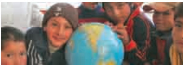
8 9 CCOO de Madrid en Bolivia, con Bolivia