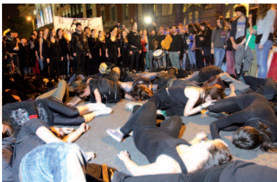
180: Jóvenes realizando una "performance" durante la manifestación realizada en Madrid

Tres jornadas de huelga contra los recortes en educación culminaron el pasado 18 de octubre con manifestaciones en más de 70 ciudades. Estudiantes, profesores y padres y madres se unieron para pedir a gritos la dimisión del ministro de Educación, José Ignacio Wert, por considerarle "responsable" de los recortes y de la "contrarreforma" educativa, que, según han advertido, "va a acabar con la escuela pública".