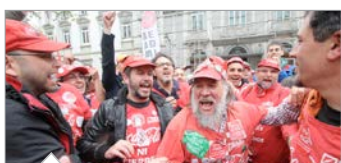
Coca-Cola vuelve a Fuenlabrada

Jueves, 3 de septiembre de 2015 número 399