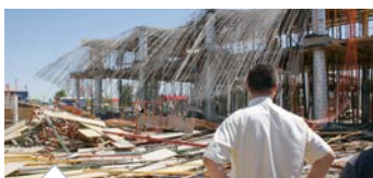
La siniestralidad laboral sigue cobrándose víctimas