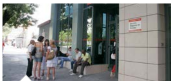
Nueva subida del paro en Madrid