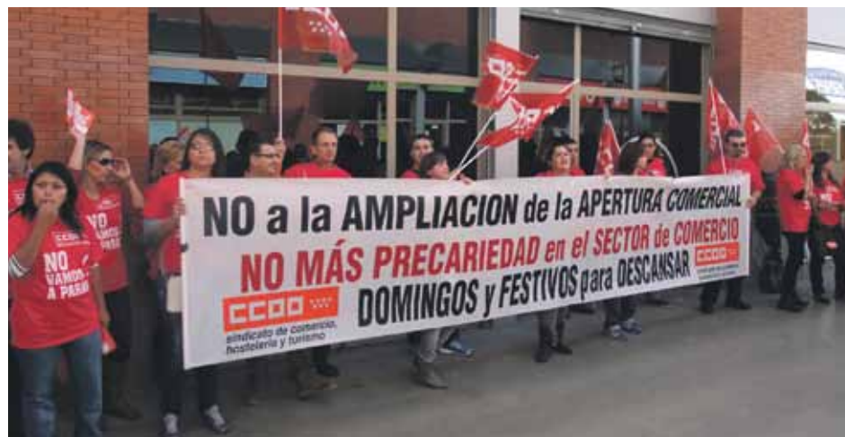
▲ En los años 2010 y 2011 la Comunidad de Madrid no hizo los reconocimientos

Presentada la correspondiente demanda de conflicto colectivo contra esta medida por los representantes de la plantilla, el TSJM se pronunció en el sentido de declarar nula la decisión empresarial al considerar que la misma se había introducido sobre lo previsto en el convenio colectivo estatal de Grandes Almacenes -que regula las condiciones laborales en Carrefour- de forma unilateral y sin seguir el procedimiento fi-