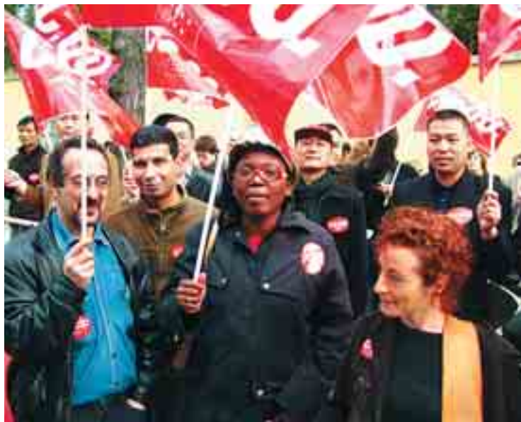
CCOO exigirá al Gobierno que la reforma propuesta no suponga una merma de derechos de las personas extranjeras.

Las modificaciones importantes de esta reforma, y que suponen un avance en materia de derechos fundamentales, se deben a la obligada aplicación de las sentencias del Tribunal Constitucional y de la Directiva europea sobre permisos de larga duración. Entre esos