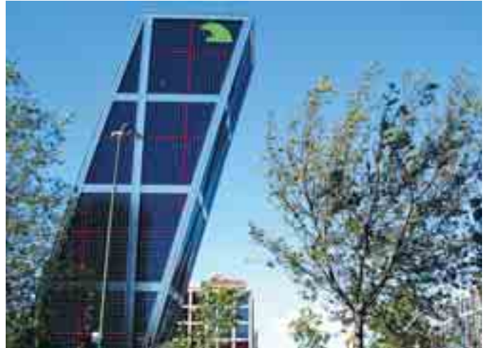
CCOO no está de acuerdo en que Aguirre consiga la mayoría absoluta en la Caja para más de seis años.

El líder regional de CCOO asegura que los municipios no están de acuerdo en aplicar la nueva Ley de Cajas y el Ayuntamiento de Madrid se siente «muy dañado» porque se reduce a más de la mitad su representación en la entidad. «Los sindicatos tampoco estamos de acuerdo en que ahora, por la vía de un cambio de ley, se nos relegue a un úl-