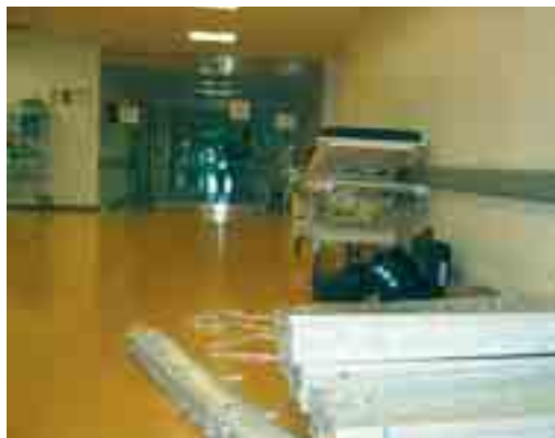
CCOO denuncia que en el Puerta de Hierro son todo deficiencias.