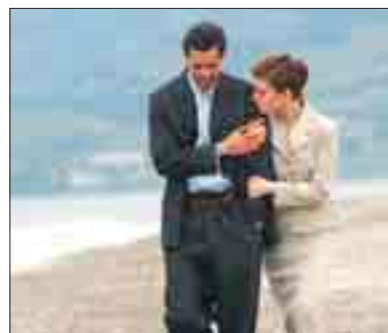
La mujer del anarquista.

La película es muy del tipo docudrama hollywoodiense, al estilo Good Night and Good Luck , para ensalzar u homenajear a figuras víctimas del propio sistema norteamericano.