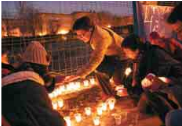
300 personas se concentraron el pasado 14 de enero ante el recinto de la Escuela Infantil «Valle de Oro», que la Consejería de Educación cerró hace un año, para reclamar la construcción de una nueva escuela de titularidad pública.

En contraste con estos datos, hay 22 millones de euros más para la privada