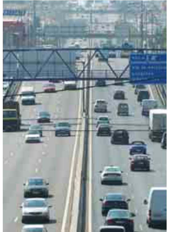
CCOO considera que sería necesaria la redacción de un nuevo estudio de impacto en caso de proseguir el proyecto de la M-60.

Para CCOO, la puesta en marcha de la M-60 obedece también a otro tipo de intereses que se co-