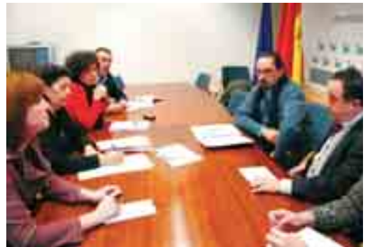
Reunión de la Mesa del Agua con IU. Próximamente se repetirá con PSOE y Partido Popular.

Por su parte, Izquierda Unida, haciendo eco de las peticiones de los miembros que componen la mesa, reclamó en la Asamblea de Madrid que la recién creada Mesa por el Agua esté representada en