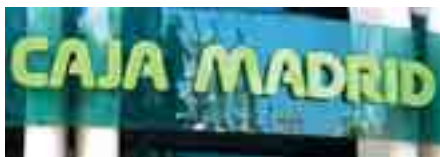
17 Caja Madrid: una llamada a la responsabilidad

CCOO 1980 COMISIONES OBRERAS DE MADRID • NÚMERO 132 • FEBRERO 2009 • WWW.CCOOMADRID.ES