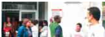
9 Alarmante paro en Madrid