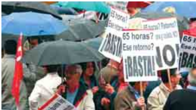
Las movilizaciones de los sindicatos en Europa han supuesto un triunfo internacional de los trabajadores.

Las movilizaciones del 7 de octubre dieron su fruto