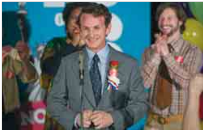
Mi nombre es Harvey Milk.