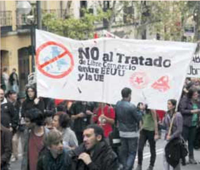
▲ Manifestación del pasado 11 de octubre en Madrid contra el Caballo de Troya que es el TTIP.

Desde febrero de 2013 la Unión Europea y Estados Unidos negocian, sin ninguna transparencia, un acuerdo comercial, conocido como TTIP por sus siglas en inglés, que pretenden, concluir a finales de 2014. Con este acuerdo, que daría lugar a la Asociación Transatlántica de Comercio e Inversión, se crearía la mayor zona de libre comercio del mundo.