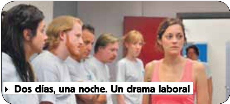
► Dos días, una noche. Un drama laboral

Director: Jean-Pierre Dardenne, Luc Dardenne