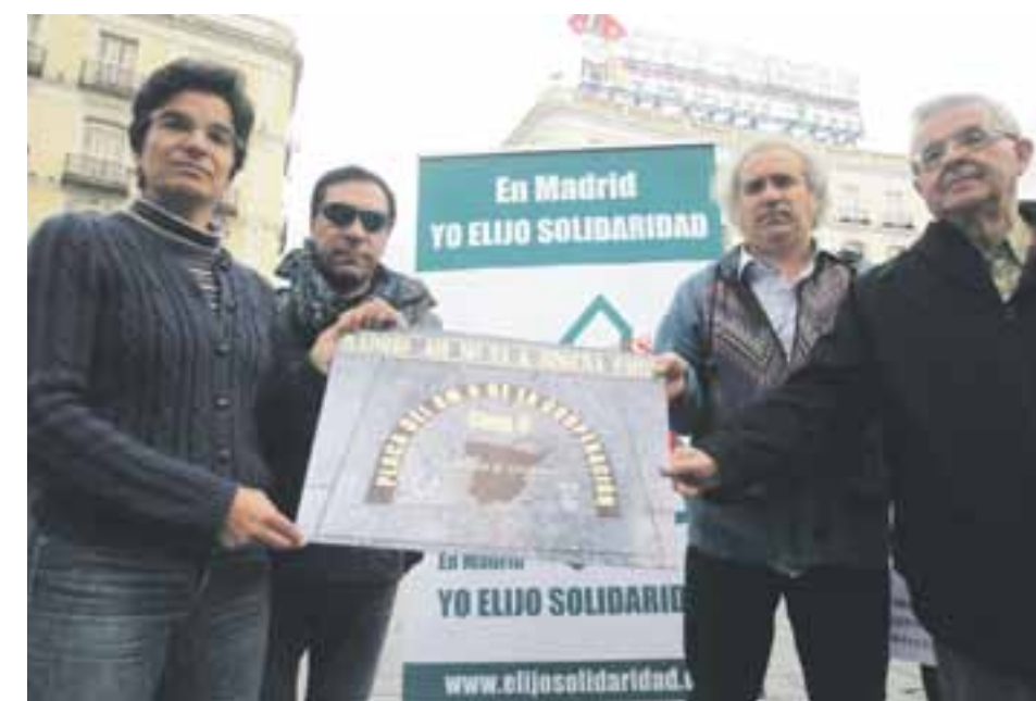
▼ Kilómetro de la cooperación: El pasado 15 de octubre una concentración la Puerta del Sol reclamó una inversión madrileña justa para cooperación.

La próxima reunión se celebrará en enero del año 2015. ■