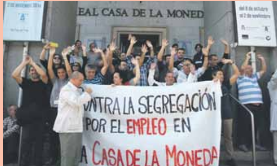
▼ La plantilla de la FNMT se concentró para defender sus puestos de trabajo.

El Comité de Empresa de la FNMT realizó un nuevo paro el día 4 de noviembre y volvió a concentrarse esta vez en las inmediaciones del Congreso de los Diputados, coincidiendo con el debate de las enmiendas al articulado de los Presupuestos Generales del Estado, en cuyas disposiciones se instrumenta jurídicamente la segregación de la actividad de fabricación de billetes. ■