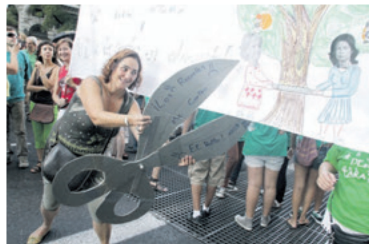
▲ «No nos van a arrebatar el futuro de nuestros hijos, de nuestros alumnos».