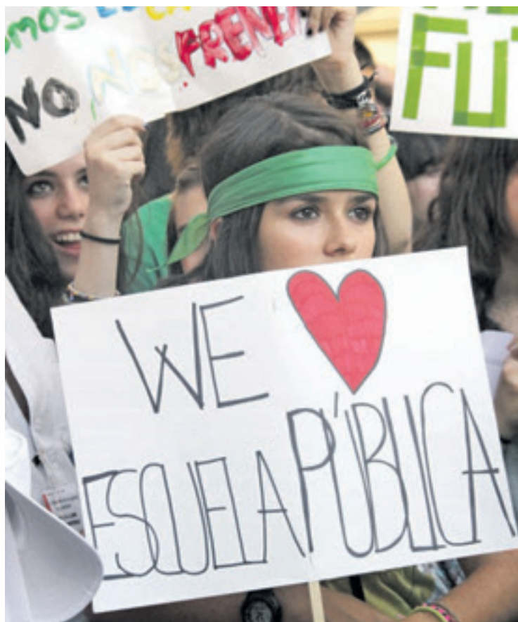
▲ El éxito de las movilizaciones realizadas por el sector de enseñanza no se daba desde 1988.

Los brutales recortes en la enseñanza pública madrileña emprendidos por Esperanza Aguirre, sus insultos al profesorado, sus declaraciones públicas desvelando sus intenciones privatizadoras han hecho que las movilizaciones llevadas a cabo en la enseñanza secundaria hayan alcanzado el calificativo de «históricas».