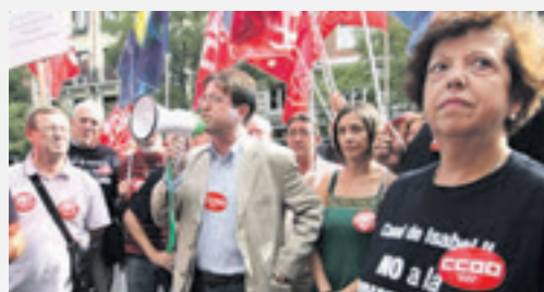
▲ Concentración frente a las oficinas del Canal de Isabel II el pasado 28 de septiembre

CCOO denunció el expediente abierto a un policía municipal por mostrar su solidaridad con el movimiento ciudadano y pacífico del 15-M. Los hechos tuvieron lugar cuando el agente, estando fuera de servicio, en su tiempo libre acudió a una asamblea pública el pasado 23 de julio. El «abuso de atribuciones» que se le imputa consistió en expresar su apoyo al movimiento y manifestar que un mundo más humano es posible. ■