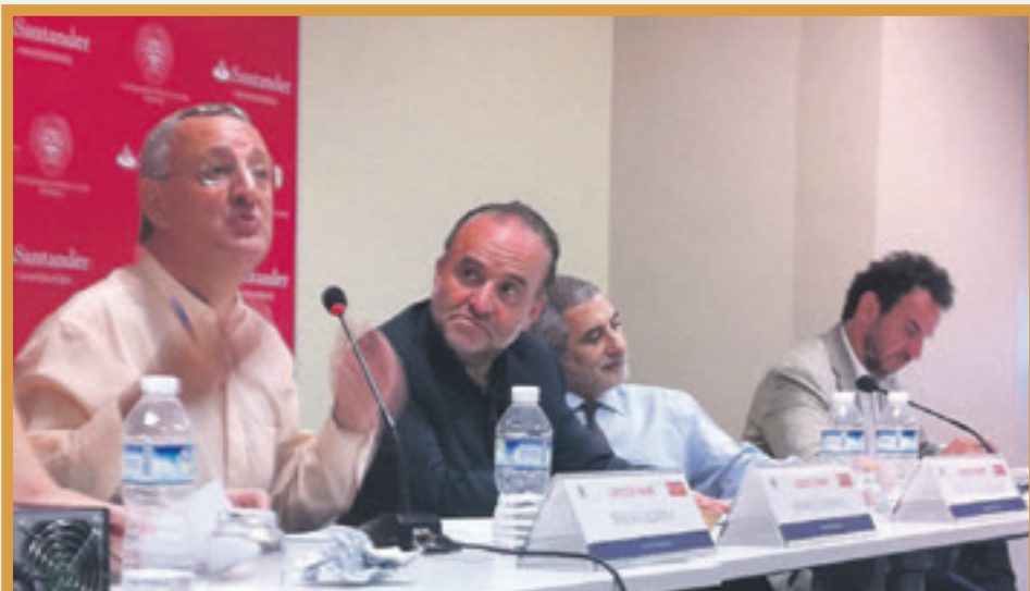
Caldera y Llamazares debatieron sobre la capacidad de respuesta de la izquierda.