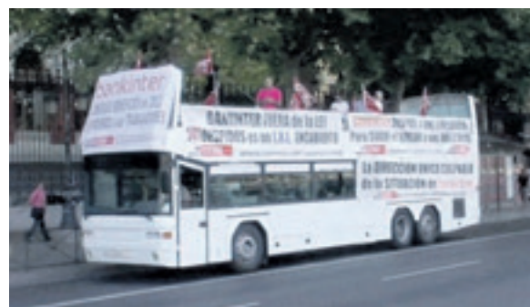
▲ Autobús de los trabajadores de Bankinter en Madrid el pasado 2 de septiembre

Ante esta situación, el sindicato ha intentado reunirse con la dirección de la empresa para analizar y buscar una solución a esta situación, el banco se ha negado a hacerlo y, lejos de cesar los despidos, han seguido con la misma política.