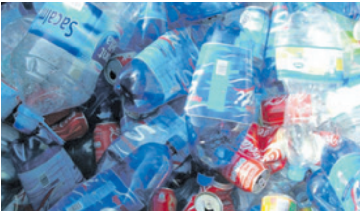
▲ La recogida de envases podría realizarse acudiendo a una máquina o puesto físico ubicados en establecimientos comerciales. A cambio, el consumidor recibe alrededor de 0,25 euros por envase.