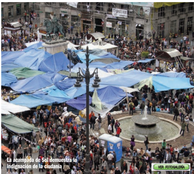
La acampada de Sol demuestra la indignación de la ciudadanía

Tras las elecciones del 22 de mayo, CCOO de Madrid ha querido felicitar tanto al pueblo madrileño por la alta participación, como a quienes han resultado ganadores y a quienes crecen en representación, especialmente IU y UPyD, lamentando los resultados del PSM, que se corresponden con el giro en las políticas del Gobierno de España y con la forma de plantear soluciones a la crisis, olvidando las necesidades ciudadanas y de los trabajadores. Unos resultados que, según el sindicato, obligan a los socialistas a una profunda reflexión sobre sus políticas en el último año, y al conjunto de los partidos a atender las demandas de los ciudadanos y de los trabajadores.