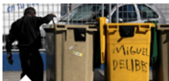
CCOO alerta del avance de la pobreza en Madrid