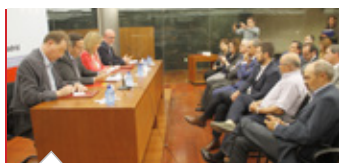
Se firman los convenios del Plan Director